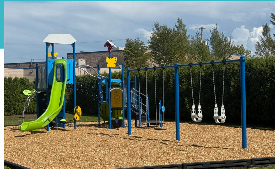
Parc au CLSC de Donnacona, dédié aux jeunes suivis par la DPJ et l'IRDPQ

Chaque don fait a un impact direct sur la santé d'une personne dans notre région.