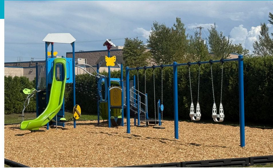
Parc au CLSC de Donnacona, dédié aux jeunes suivis par la DPJ et l'IRDPQ

Chaque don fait a un impact direct sur la santé d'une personne dans notre région.