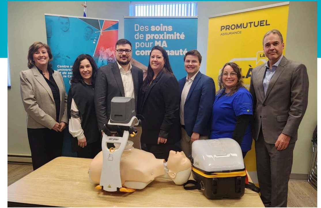
Système de compression thoracique LUCAS en collaboration avec Promutuel