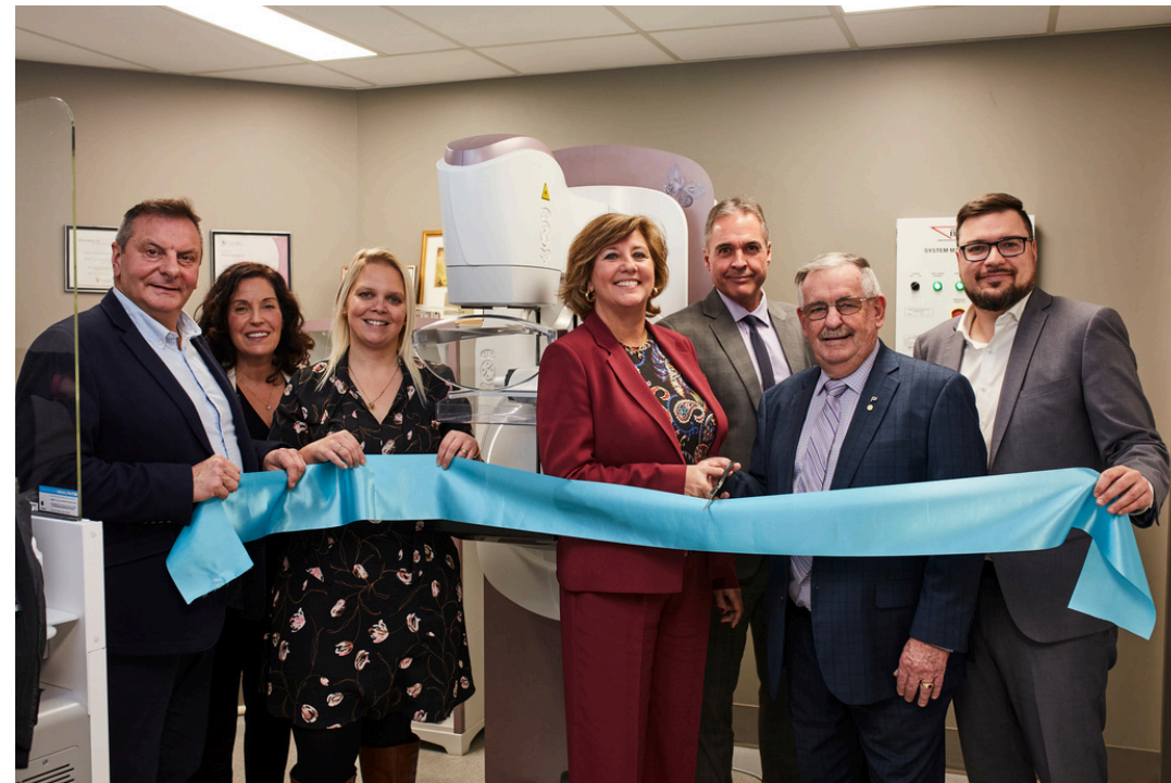
Tomosynthèse 3D en collaboration avec Promutuel