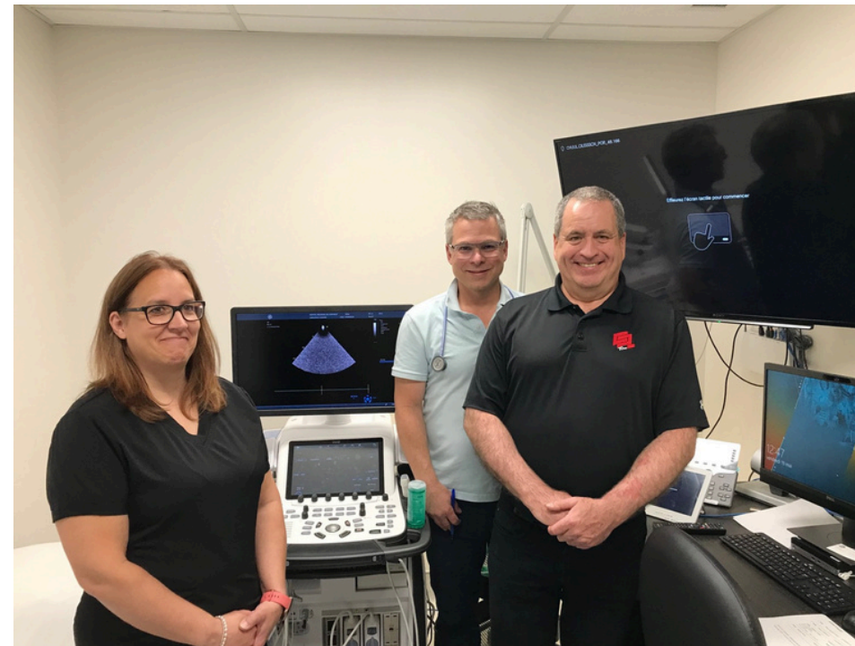
Échographie cardiaque en collaboration avec Ciment Québec